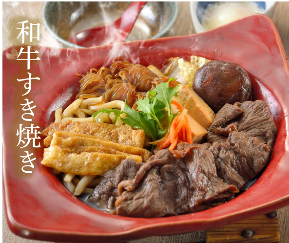
和牛すき焼き WAGYU SUKIYAKI 和牛すき焼き Set meal $34.00- À la carte $30.50-