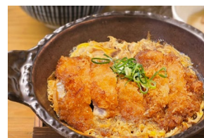
CHICKEN KATSU-TOJI NEW チキンかつとじ Set meal $24.80- À la carte $21.30-