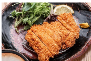
CHICKEN KATSU チキンかつ Set meal $23.80- À la carte $20.30-