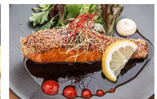
SPICY SALMON TERIYAKI スパイシーサーモン照焼き Set meal $27.80- À la carte $24.30-