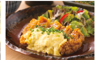
CHICKEN NAMBAN チキン南蛮 Set meal $24.80- À la carte $21.30-