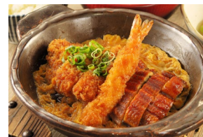
UNAGI MIX TOJI (PORK LOIN KATSU + FRIED PRAWN + UNAGI) うなぎミックスとじ Set meal (Unagi) $27.00- À la carte (Unagi) $23.50-