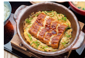
UNAGI TOJI うなぎとじ Set meal (Double) $43.00- Set meal (Single) $32.00- À la carte (Double) $39.50- À la carte (Single) $28.50-