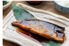
TERIYAKI SABA 照焼き鯖 Set meal $21.80- À la carte $18.30-