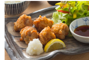
CHICKEN KARA-AGE (MILD or SPICY) 唐揚げ (ノーマル or スパイシー) Set meal $20.80- À la carte $17.30-