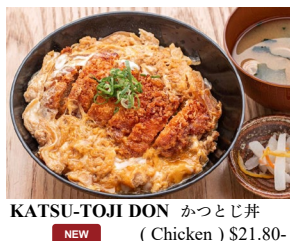
KATSU-TOJI DON NEW かつとじ丼 (Chicken) $21.80- (Pork Loin) $19.80-