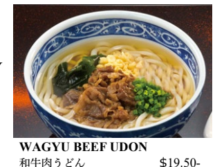
WAGYU BEEF UDON 和牛肉うどん $19.50- NEW Add Extra Wagyu +$6.00-