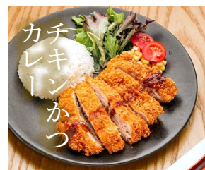
CHICKEN KATSU CURRY チキンかつカレー $28.30-