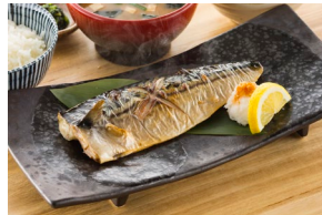
SABA SHIO-YAKI 鯖塩焼き Set meal $21.80- À la carte $18.30-