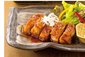
TERIYAKI CHICKEN 照焼きチキン Set meal $22.80- À la carte $19.30-