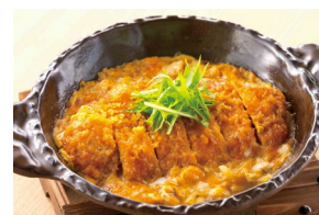
PORK LOIN KATSU-TOJI ロースかつとじ Set meal $22.80- À la carte $19.30-