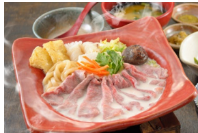
WAGYU SOY MILK HOT POT 和牛豆乳鍋 Set meal $34.00- À la carte $30.50-