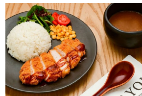
PORK LOIN KATSU CURRY ロースかつカレー $26.80-