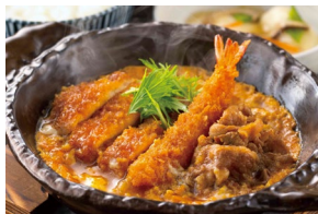
MIX TOJI (PORK KATSU + FRIED PRAWN + WAGYU) ミックスとじ (和牛) Set meal (Wagyu) $23.80- À la carte (Wagyu) $20.30-