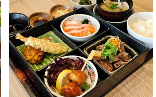
YAYOI GOZEN (WAGYU SUKIYAKI, TSUKUNE MEATBALL, TEMPURA - MIX VEGETABLE & PRAWN, and SALMON SASHIMI) *Ingredients may vary やよい御膳 Set meal $39.00-