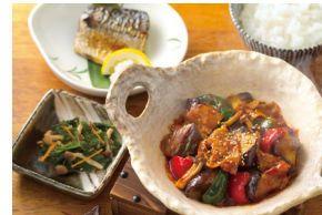
NASU MISO & SABA SHIO-YAKI 茄子味噌と鯖の塩焼き Set meal $25.80- À la carte $14.30-