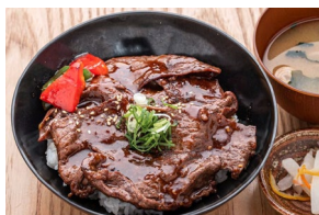
WAGYU YAKINIKU DON 和牛焼肉丼 $25.50- NEW Extra Wagyu +$8.00-