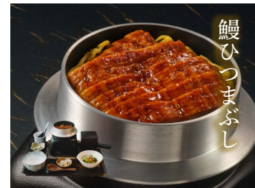
UNAGI HITSUMABUSHI うなぎひつまぶし