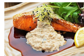
SALMON TERIYAKI サーモン照焼き Set meal $27.80- À la carte $24.30-