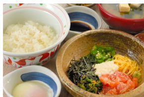
OMAZE DON おまぜ丼 $23.80-