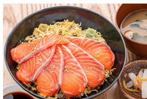
SALMON DON サーモン丼 $25.50-