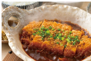
MISO PORK LOIN KATSU 味噌かつ Set meal $23.80- À la carte $20.30-