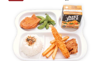
KID'S MEAL (RICE or UDON) お子様セット (ご飯orうどん) $14.00-