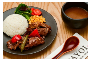
WAGYU YAKINIKU CURRY 和牛焼肉カレー $28.80-