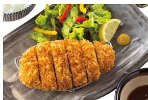
PORK LOIN KATSU ロースかつ Set meal $21.80- À la carte $18.30-